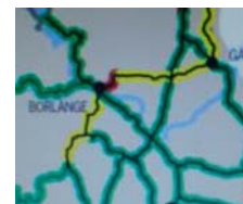
Mellansveriges mest belastade järnväg 2015

Ny räls och nya mötesstationer för 300 miljoner längs en kurvig sträcka längs Runn eller påbörjade dubbelspår vid järnvägens infarter till Falun respektive Borlänge? Svaret kan verka självklart, särskilt som Falun, Borlänge och Trafikverket är överens om att en ny genare sträckning är den enda långsiktigt hållbara lösningen. Ändå står vi vid ett (järn)vägskal där det första kan bli verklighet. En ny sträckning med dubbelspår är dyrt. Men frågan är: Har vi råd att felinvestera fler hundra miljoner?