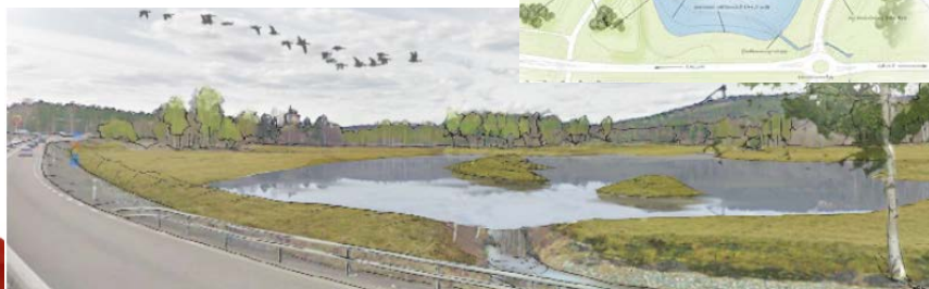
Nya Myran, sedd från rondellen vid ICA Maxi. Till höger blir det ett nytt verksamhetsområde, med bl a mack och bilaffär, men inget nytt köpcentrum. Marken vid Högs skolan behålls för framtida expansion och utveckling.